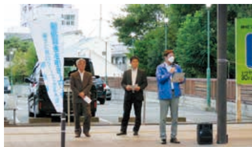
最低賃金引き上げの必要性を訴える街頭行動

そして私たち会津若松地区連合会、地方連合会である連合福島の地域協議会に位置しており、地元根差した運動を心がけています。 “働くことを軸とする安心社会”をめざし、すべての働く人たちの雇用とくらしを守るための活動に取り組んでいます。 どうぞよろしくお願い致します。