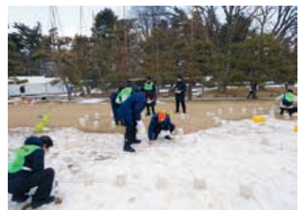
絵ろうそくまつりボランティア