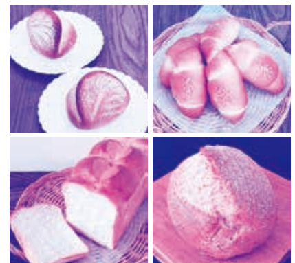
講師作品パン (今回の教室で焼くパンの見本ではありません)