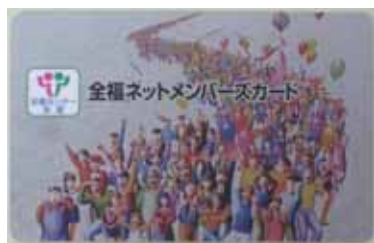
クレジット機能なしカード<表面>

このカードは「あしすと割引指定店」と 全国約20,000件の「全福センター割引協定施設」でご利用いただけます。 ホテル・旅館・ペンション・レジャー施設・ゴルフ場・スキー場など バラエティ豊かな割引協定施設で割引・優待サービスをお受けいただけます。 あしすと割引指定店では、カード裏面の<あしすとマーク>を提示してください。